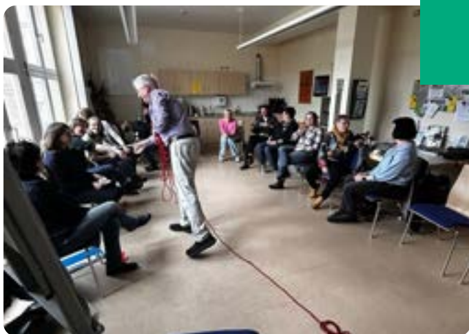
Die LAG Thüringer Selbsthilfeplenum in den Räumen des Erfurter Gesundheitsamtes.