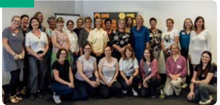
Die Kolleginnen der Selbsthilfe- und Landeskontaktstellen aus Thüringen und Sachsen beim Netzwerktreffen in Dresden.

Das Netzwerktreffen der Kolleg*innen aus Sachsen und Thüringen wurde in diesem Jahr durch die LAKOS Sachsen organisiert und fand vom 03.-04. September 2025 in Dresden statt.